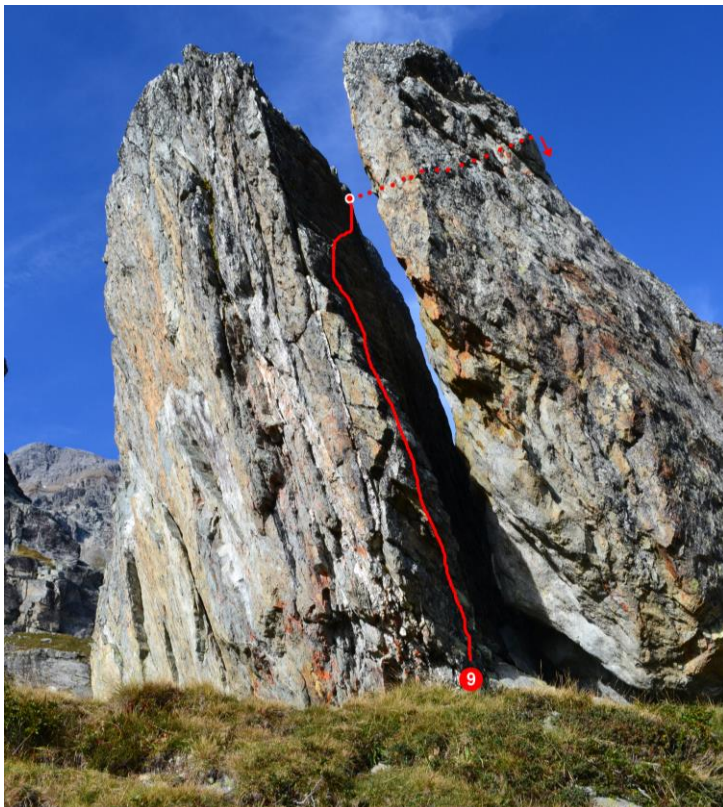
9 Kaminfeger 4c (Ansicht SW)